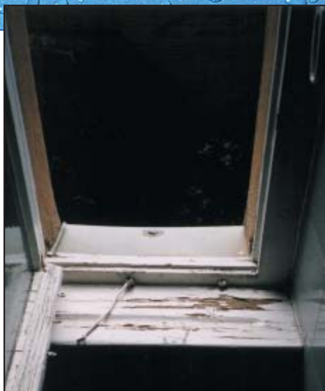
Ventana con fugas - el moho está empezando a crecer en el marco de madera y en el apoyo de la ventana.

Si ya tiene un problema con el moho — ACTÚE RÁPIDAMENTE.